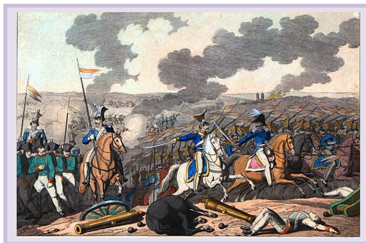
Bitwa pod Iganiami

Oceń czy powstanie listopadowe miało szanse powodzenia. (Pisemnie)