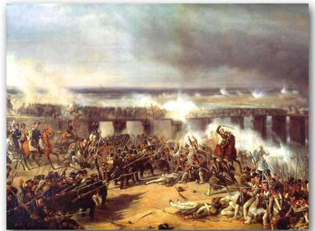
Bitwa pod Ostrołęką 1831 na obrazie Karola Malankiewicza