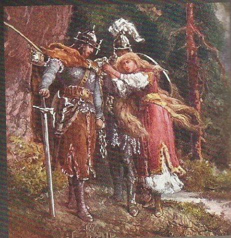
Ilustracja do Lilli Wenedy , dramatu Juliusza Słowackiego. Jest to mityczna opowieść o początkach Polski. Słowacki, tak jak Adam Mickiewicz i Zygmunt Krasiński, był uważany za polskiego wieszczę – duchowego przywódcę narodu. Przedstawił własną koncepcję walki narodowowyzwoleńczej.

W polskiej kulturze romantyzm to niezwykle ważna epoka literacka. Jej początek wyznacza opublikowanie Ballad i romansów Adama Mickiewicza w 1822 r., a koniec – upadek powstania styczniowego w 1864 r. Idee romantyczne wpłynęły również na polską muzykę i sztukę. Przedstawiciele tego nurtu tworzyli zarówno na emigracji, jak i pod zaborami. Na ziemiach polskich działali m.in. malarz Piotr Michałowski i kompozytor Stanisław Moniuszko, uznawany za twórcę polskiej opery narodowej.