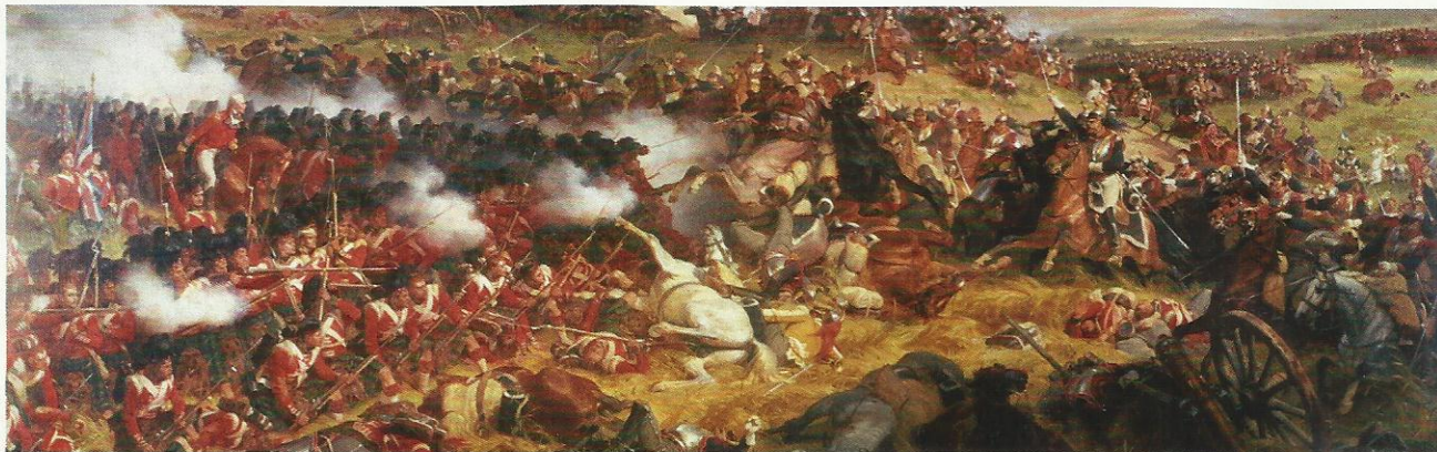
Bitwa pod Waterloo została przedstawiona na obrazie francuskiego artysty Henriego Felixa Philippoteaux z połowy XIX w. Uwieczniono decydujący moment starcia, kiedy brytyjska piechota, ubrana w charakterystyczne czerwone kurtki, odparła zmasowany atak francuskiej kawalerii. Ten sukces przesądził o klęsce Napoleona.

Z czasem pokonana Francja, w której tron objął Ludwik XVIII, zaczęła odgrywać na kongresie coraz większą rolę. Sprawili to działania francuskiego ministra spraw zagranicznych Charles’a Talleyranda [czyt.: szarla talejranda], który starał się zapobiec osłabieniu swojego kraju.