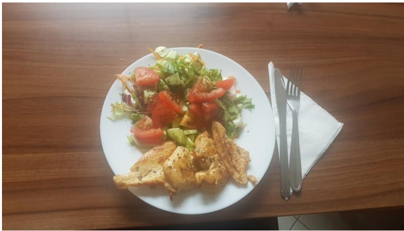
Občas sme poupratovali a navarili si