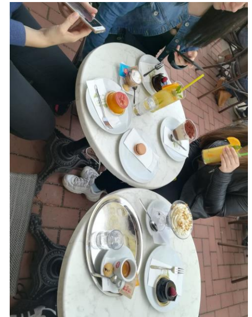
Pozreli sme sa aj do známej cukrárne, kde koláčiki chutili naozaj skvelo