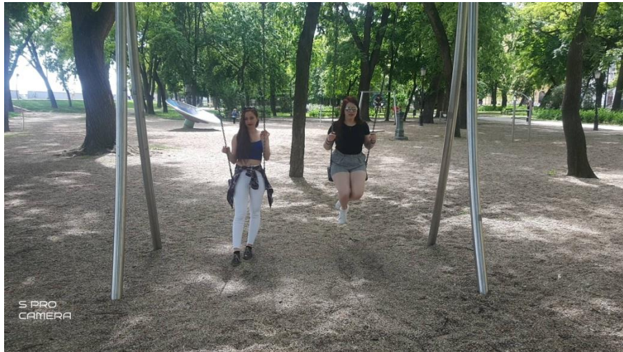
Navštívili sme park